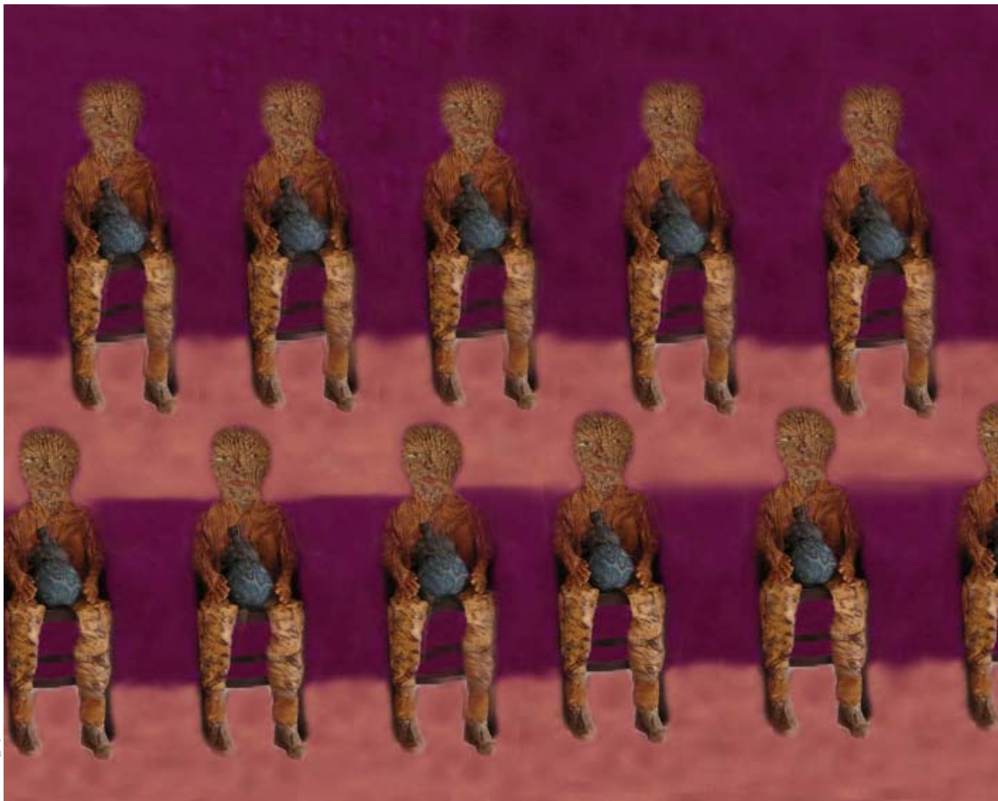
Celina Carvalho - Encontro universal dos guardiões das sombras, do tempo e do universo - pintura mista sobre tecido - 2010.

ao se contemplar esses opostos que se sintonizam, praticamente se completam, sendo um a causa da existência do outro.