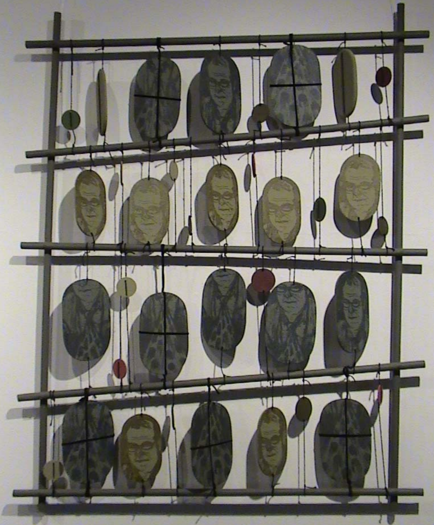
Paulo Cheida Sans - Deposítório para um anjo III - linogravura sobre madeira - 2009.